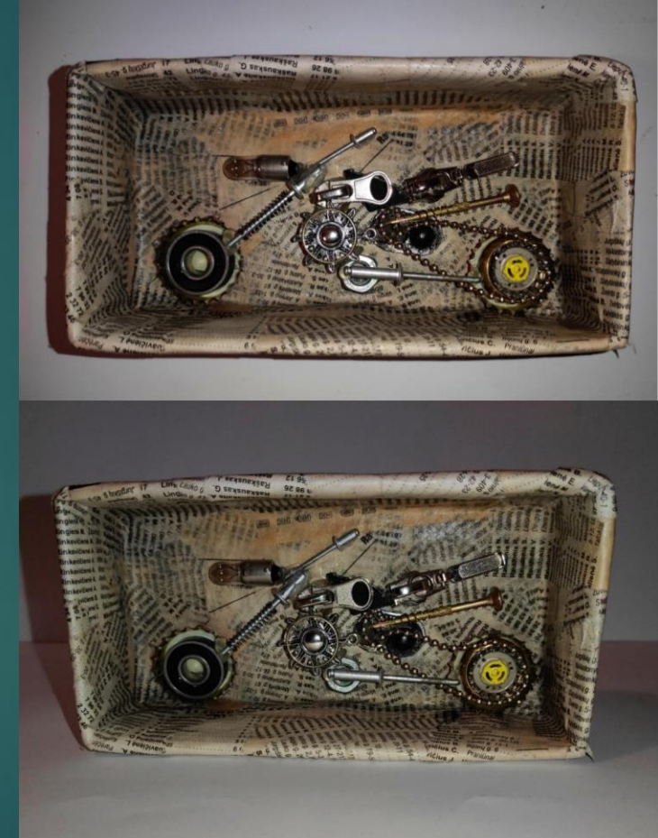
Dominyka Bucevičiūtė 2a kl.