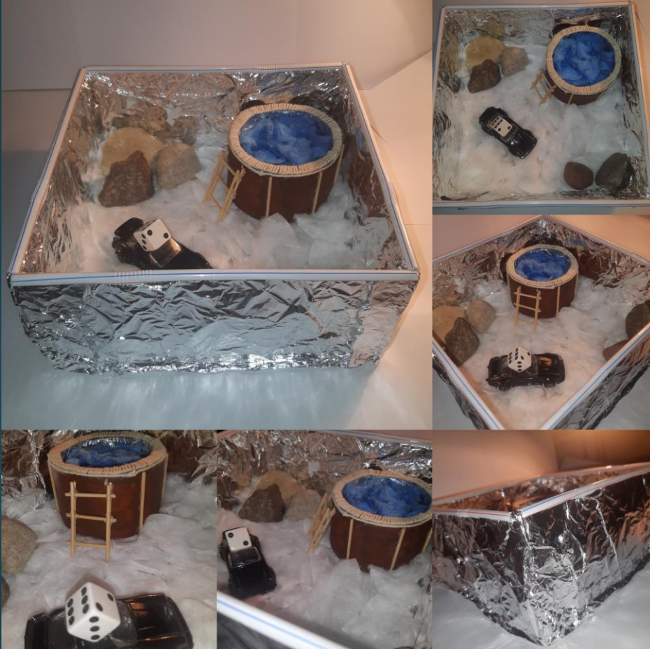
Airūnė Keršytė 2a kl.