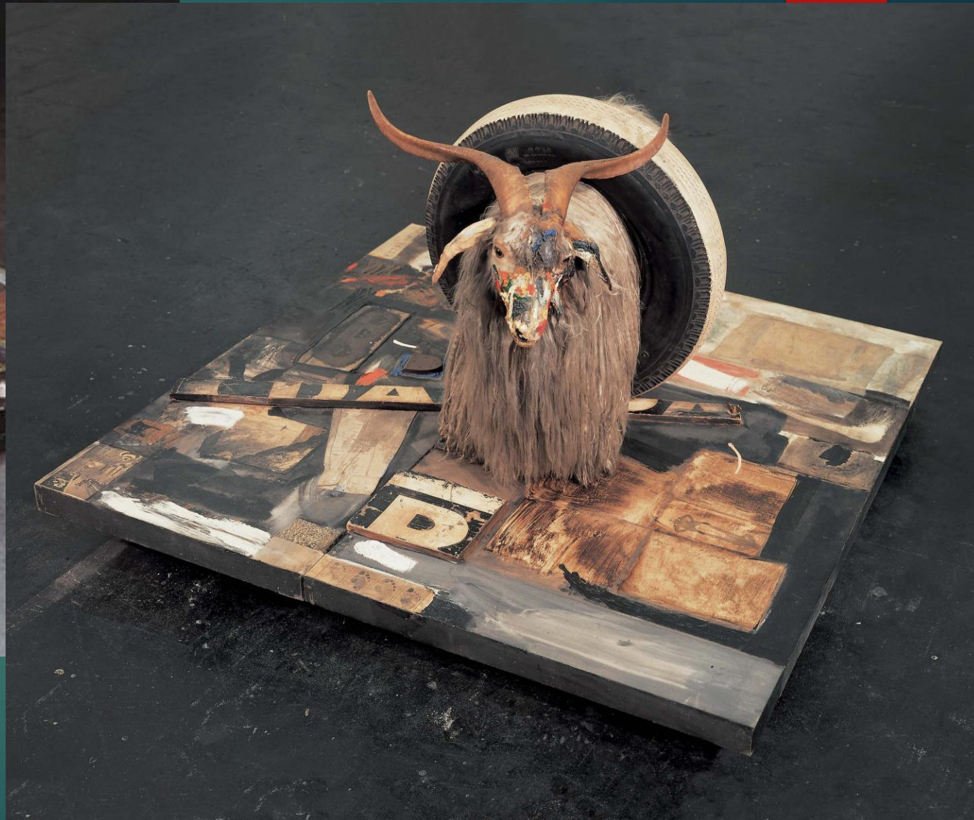
R.Raušenbergas Monograma. 1955-59 m. Medžiagos: Ožkos iškamša, padanga.