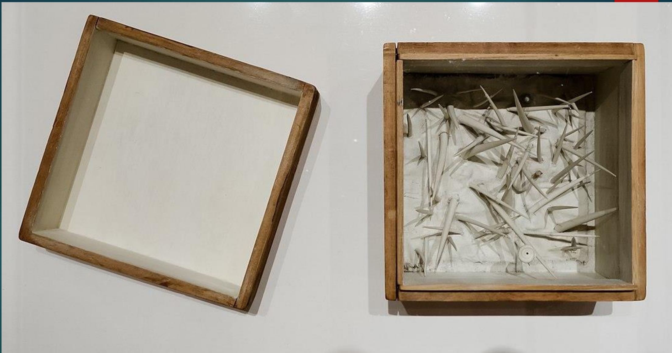
Robertas Rauschenbergas, Be pavadinimo. 1952 m., Medžiagos: uždengiama medinė dėžutė su dažytu interjeru, dažytas audinys, spygliai ir sraigų lukštai.