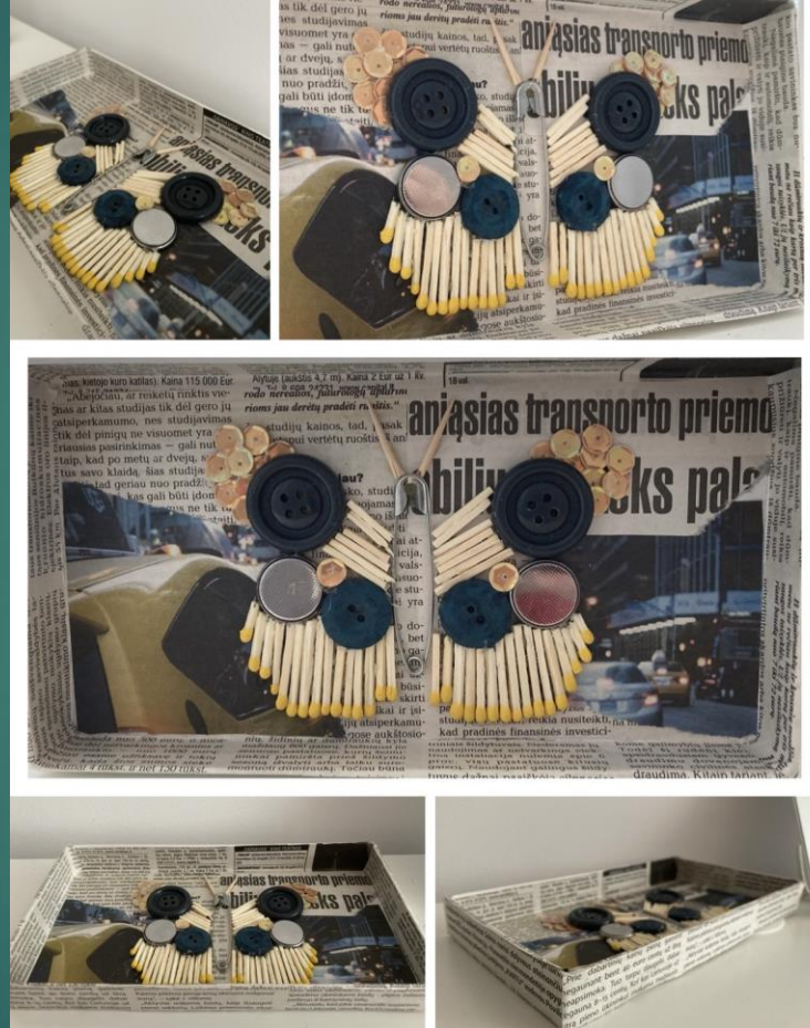
Eglė Struckutė 2c kl.