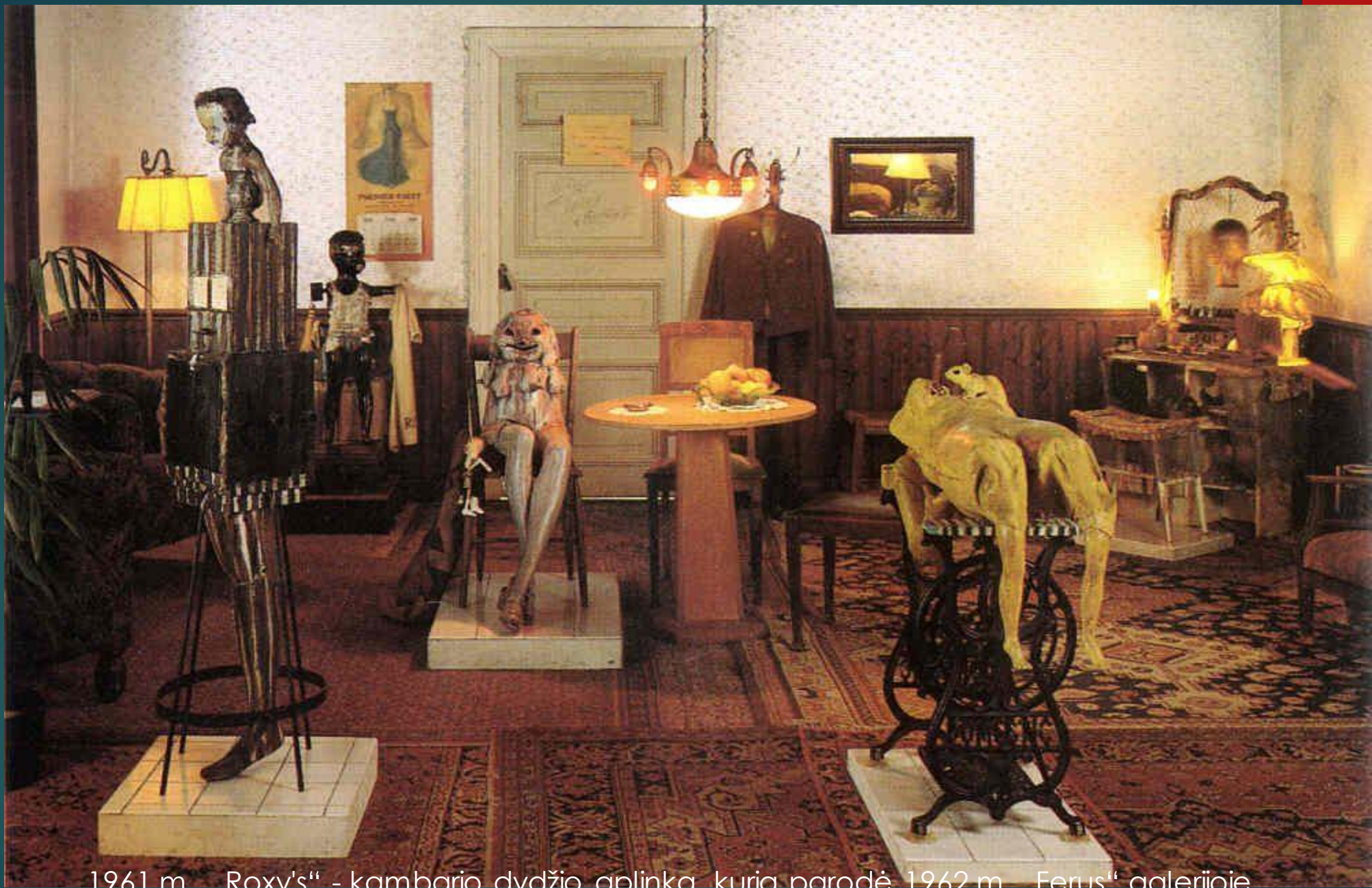
1961 m. „Roxy's“ - kambario dydžio aplinka, kurią parodė 1962 m. „Ferus“ galerijoje. Medžiagos: antikvariniai daiktai, baldai, 30-ųjų muzikinis aparatas, senovinės smulkmenos ir satyriniai personažai – manekenai.