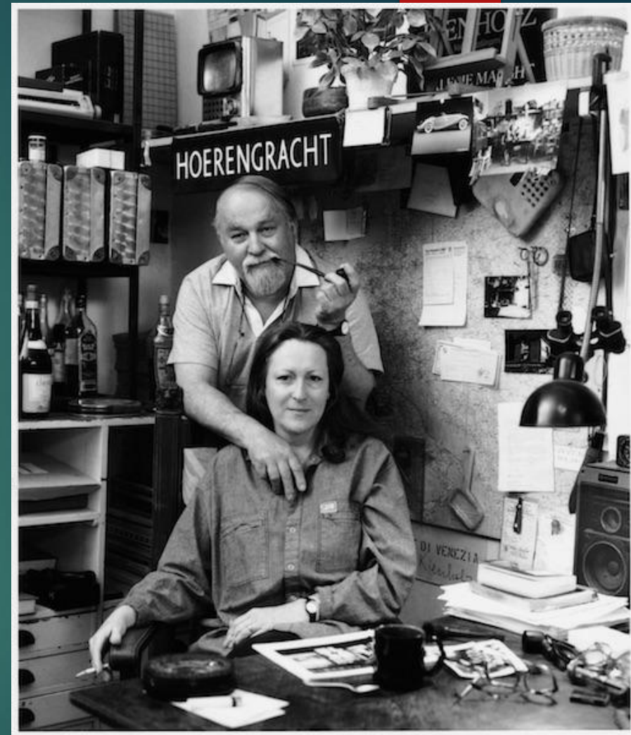
Edwardas Kienholzas bei jo žmona ir bendradarbė Nancy Reddin Kienholz