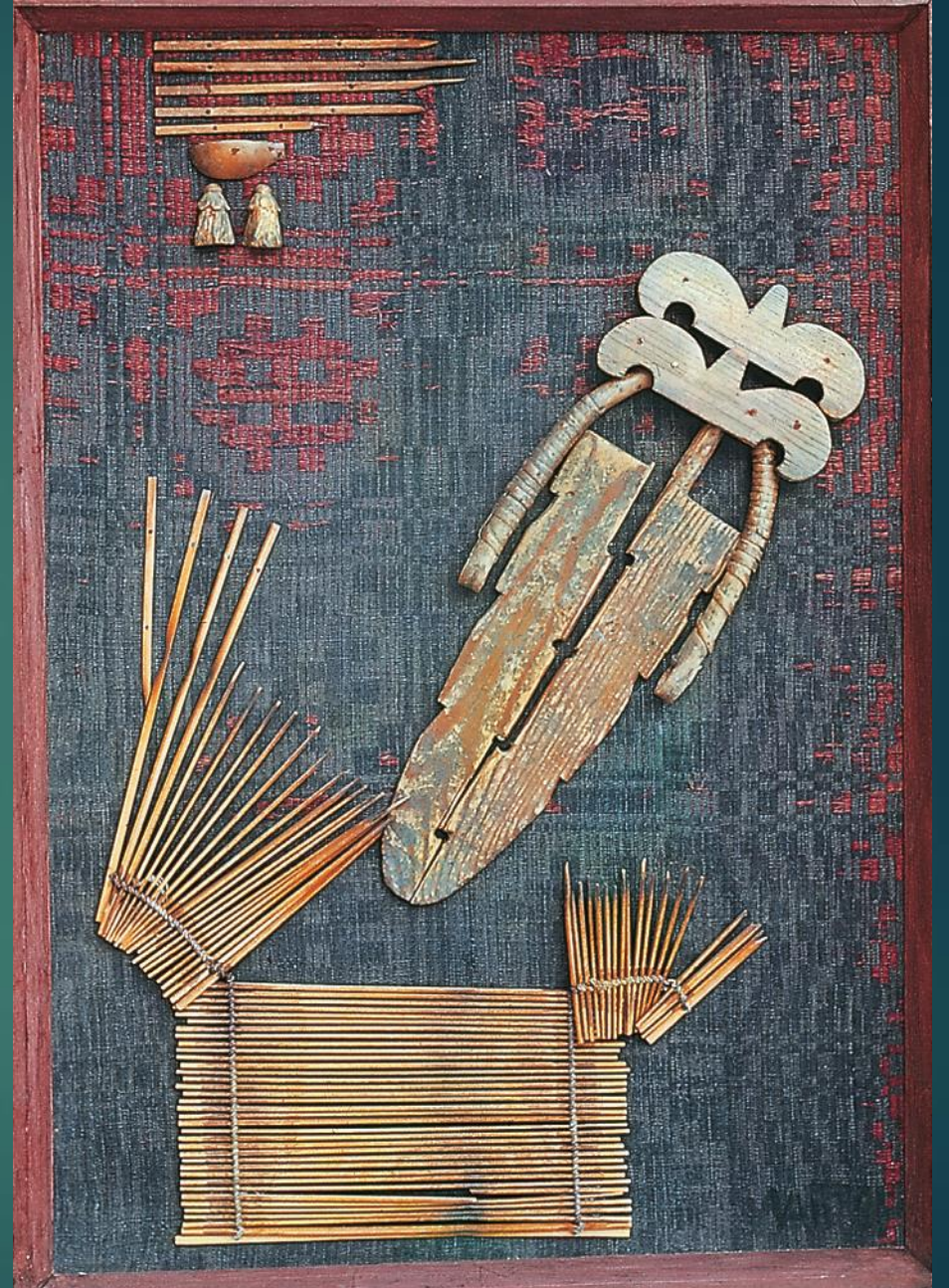
V. Antanavičius. „Istorinis personažas“ 1981